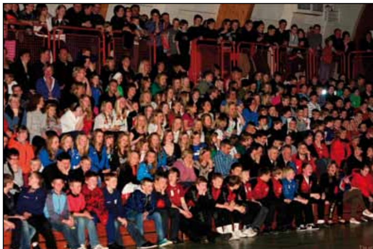
Troðfullir bekkir á Húsavíkurmóttinu 2009