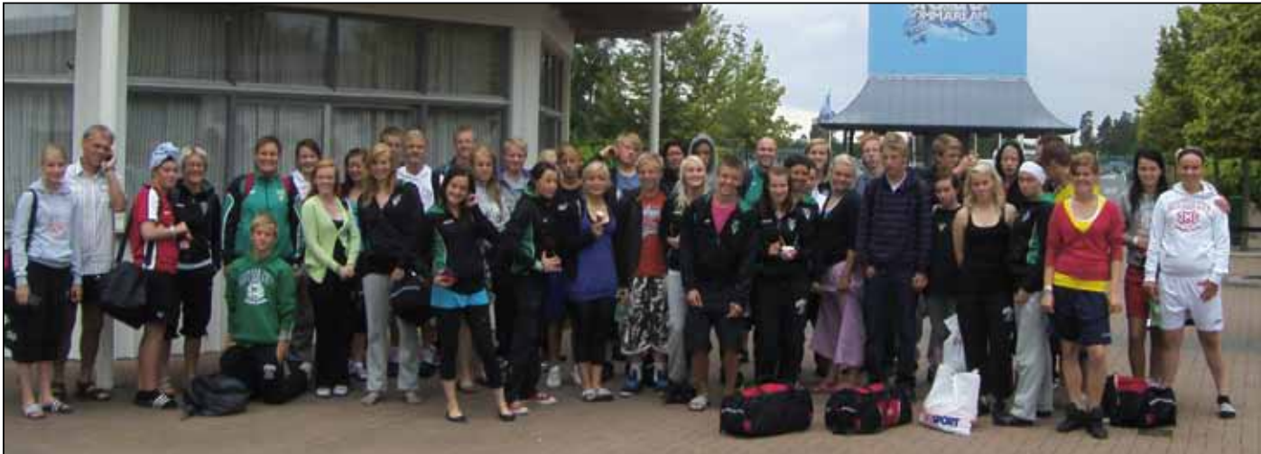
Þátttakendur, þjálfarar og fararstjórar á Gothia Cup í Svíþjóð sumarið 2009.

-efnilegt íþróttafólk og skemmtilegir unglingar