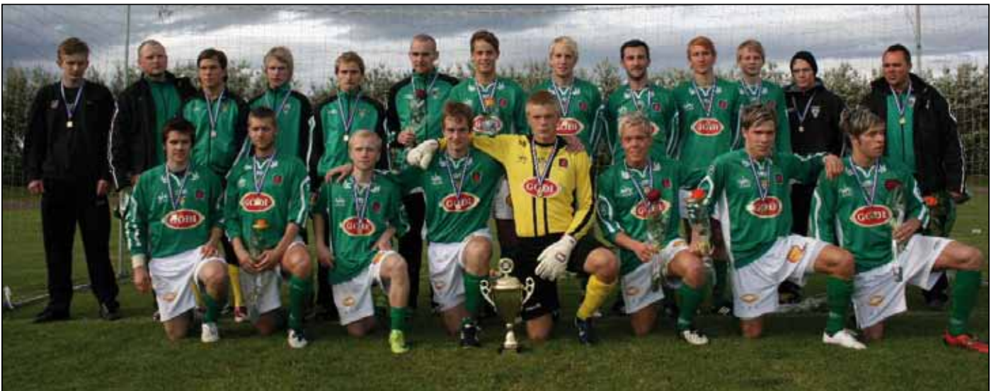
Íslandsmeistarar í 3. deild - Völsungur.