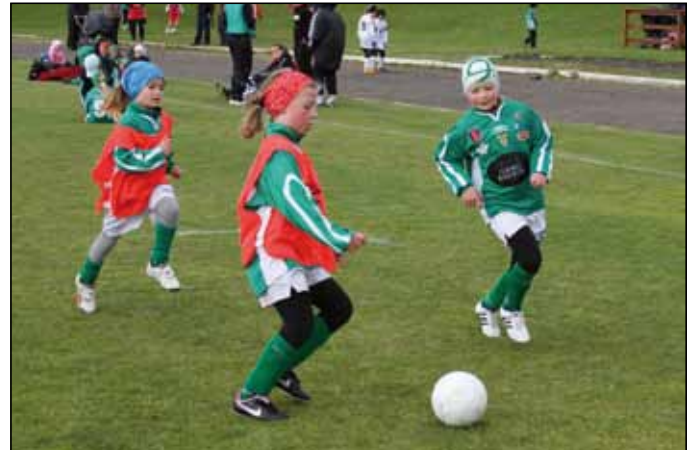
Frá Eimskipsmótinu 2009.