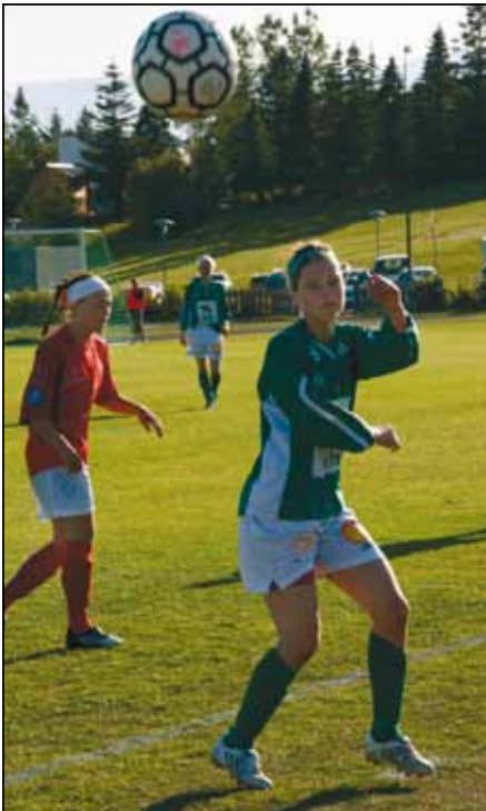
Úr bikarleik Völsungs og Vals.

Þetta var annað árið sem þjálfari starfaði með meistaraflokki kvenna hjá Völsungi. Allir voru staðráðnir í að lyfta leik liðsins enn hærra og gera okkur enn samkeppnishæfari á landsvísu.