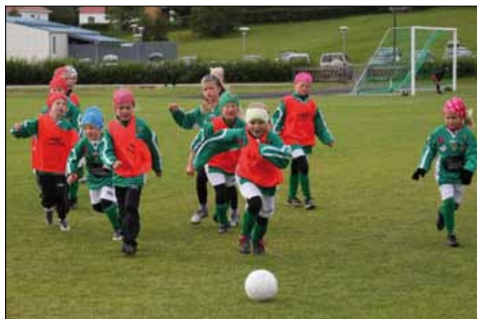
Frá Eimskipsmótinu 2009.