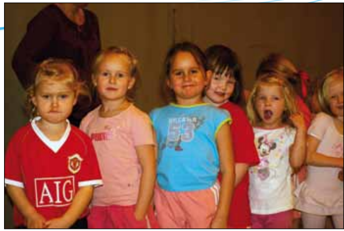
Í Íþróttaskóla Völsungs