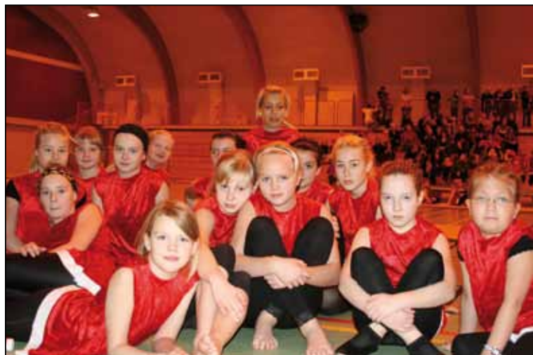
Tekið á jólasýningunni 6. des. Stjórnin ásamt fleiri góðum mömmum og ömmum saumuðu jólabúning á allan hópinn.