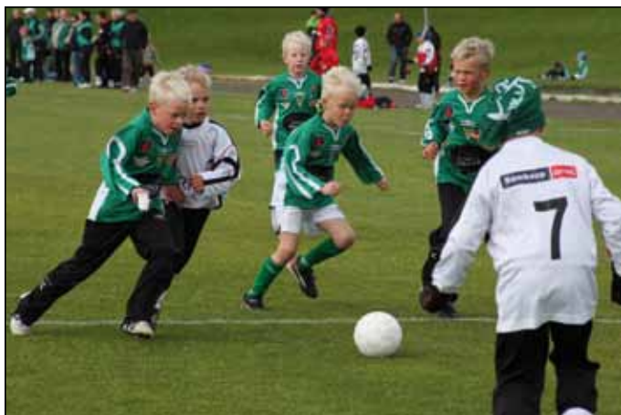
Frá Eimskipsmótinu 2009.