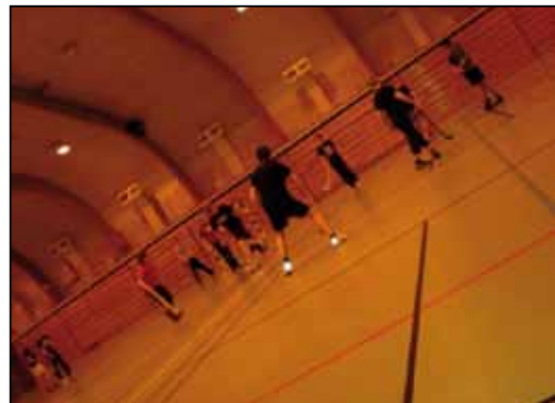
Bandí - street

Haldin hafa verið tekkenmót, pönnuköku- og vöfflukvöld, spilakvöld, bíókvöld, tónleikar í samstarfi við Kelduna, vinakvöld, stráka- og stelpukvöld, leikjakvöld og margt fleira skemmtilegt. Við höfum aðgang að salnum í íþróttahöllinni eitt kvöld í viku og höfum við þá spilað bandí-street. Einnig höfum við haft aðgang að litla salnum á mánudagskvöldum og þá höfum við stundum brugðið okkur í boccia.