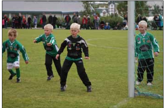
Frá Eimskipsmótinu 2009.