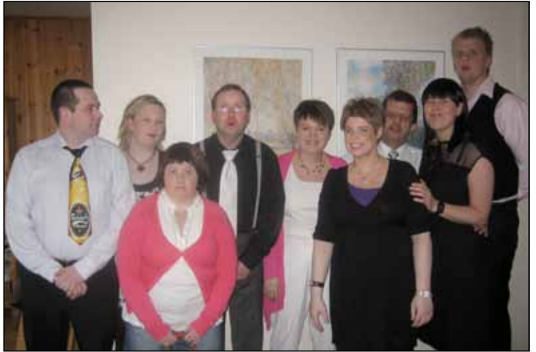
Okkar fólk tilbúið á lokahóf eftir Hængsmót 2009.