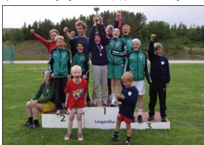
Völsungar í frjálsum.