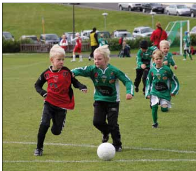
Frá Eimskipsmótinu 2009.

5. september lékum við svo í undanúrslitum C-deildar Íslandsmótsins gegn Grindavík. Leikurinn var spilaður á Sauðárkróki og tapaðist hann 3-1 og er óhætt að segja að við höfum ekki átt okkar besta dag þann daginn. Það verður því að bíða næsta árs að komast uppúr C-deildinni.